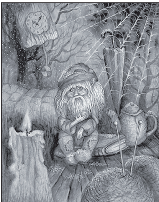
Домашният дух е смятан за покровител на семейството

В българското семейство винаги са съществували прости, но рационални правила за организирането на жизненото пространство. В народната памет не се е съхранило единно и стройно учение, подобно на фън шуй, но в десетки ритуали и обреди са се запазили отгласи от далечни познания за хармонизиране на енергийната среда на битово ниво.