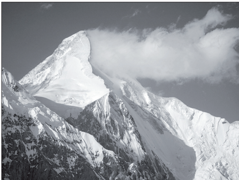
Връх Тенгри, планина Тяншан

Кои в действителност сме ние? Защо в цяла Азия и Източна Европа непрекъснато се намират следи от нашето пребиваване и култура? Защо пазим древни обичаи и традиции, които нямат аналог в световната история? Откъде идваме и накъде вървим?