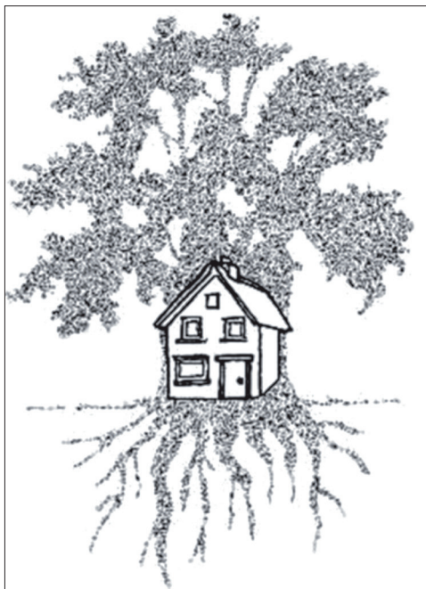
В българските вярвания домът е жива система

Пазителят на къщата е разглеждан като енергийно същество, хранещо се с всякакъв тип енергии, което силно влияе на неговата същност. Например негативната енергия, излъчвана от кавги, спорове и зли хора, действа лошо на домашния дух. Попивайки буквално като гъба отрицателните енергии, той самият се превръща в зъл дух и започва да вреди на семейството. Но когато домът излъчва положителна енергия и в него царят хармония и радост, домашният дух се старее да запази това състояние. Той с всички сили защитава жилището, възприемайки го като втора своя същност.