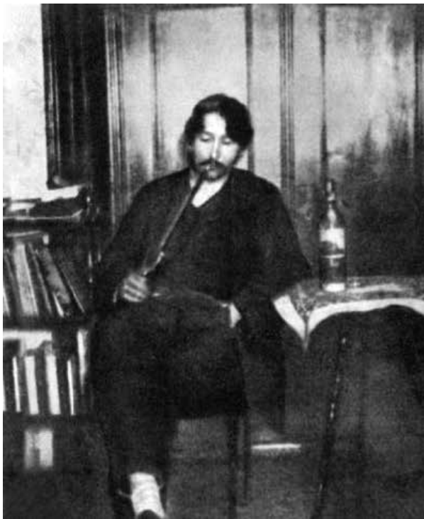
Анархистът Ярослав Хашек размишлява върху формите на женското тяло и непредвидимите последиствия, произтичащи от тях.