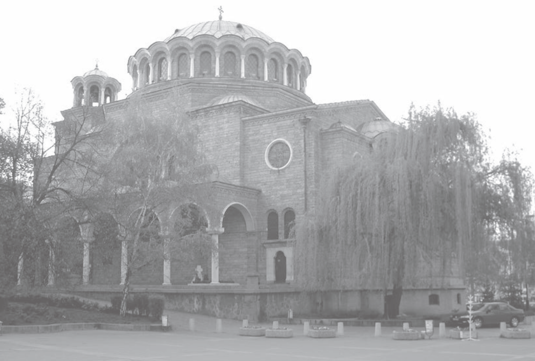
Църквата „Св. Неделя“