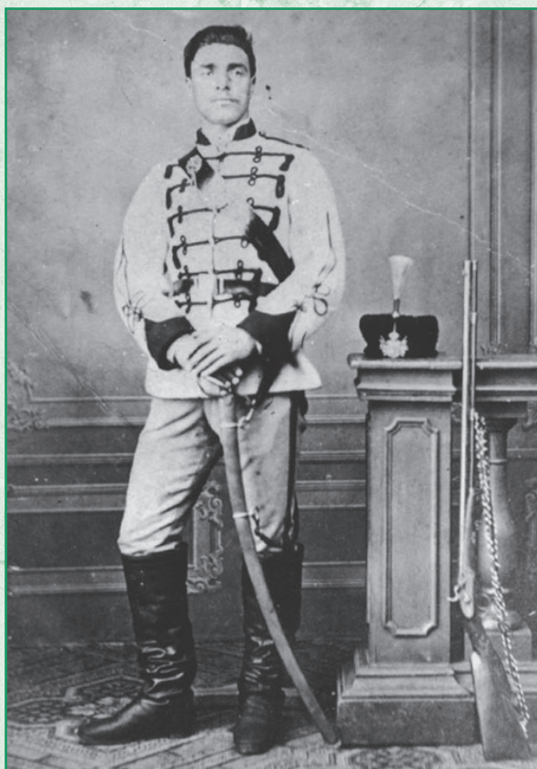
Левски в униформа на Първата българска легия

В отряда, наречен по-късно „Първа българска легия“, доброволците, облечени в красиви униформи, се обучавали на военни умения – стреляли, прескачали ровове, преодолявали високи препятствия, учили се как да се прегрупират за нападение или отстъпление и упражнявали всичко, което можело да им помогне да победят в сражение.