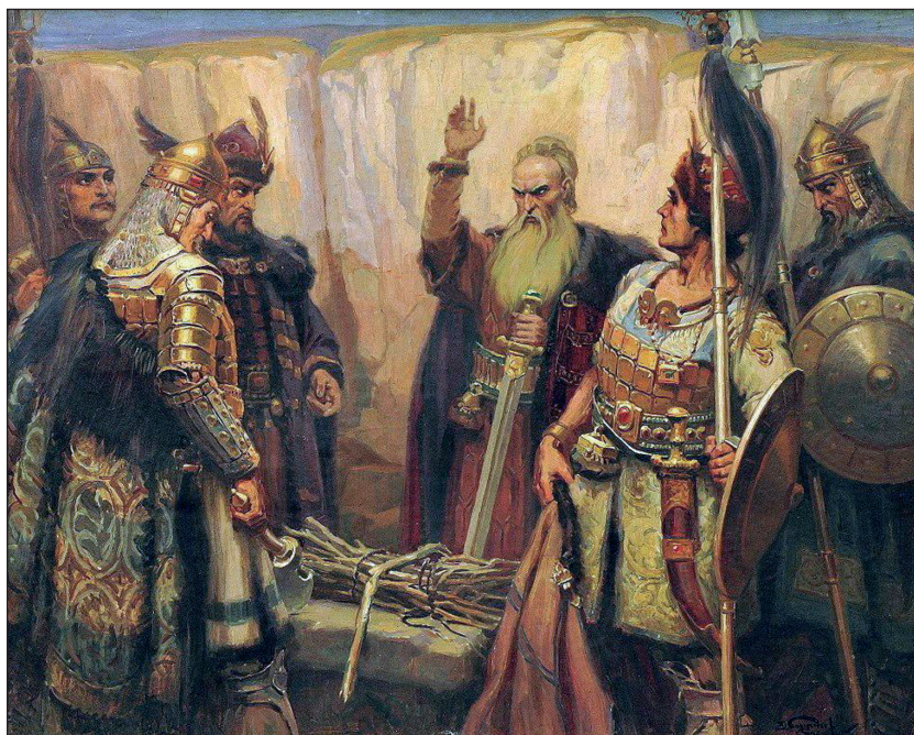
Легендата за хан Кубрат и синовете му.

После прабългарите се съюзили с живеещите на юг от Дунава седем славянски племена. През пролетта на 681 г. заедно с тях те подновили нападенията си срещу византийските градове и крепости. Като не могъл да им се противопостави, император Константин IV сключил мирен договор с тях и се съгласил да им плаща годишен данък. Така Византия признала възникването на новата държава. Това било Първото българско царство. Границите му се простирали от Черно море на изток до река Тимок на запад, от Стара планина на юг, до река Днепър на север, а столицата се наричала Плиска. От 681 г. до днес тази държава носи името България.