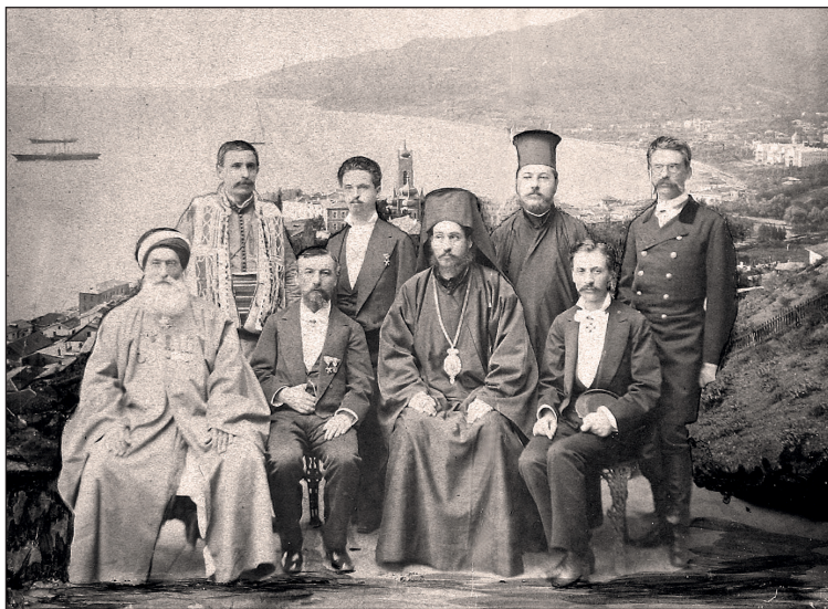
Делегацията от Първото Велико народно събрание, която връчва на принц Батенберг решението за избора му за княз на България, 1879 г.

които тогава командвали света, наречени Велики сили. Това били: Русия, Германия, Франция, Великобритания и Австро-Унгария. Князът трябвало да бъде одобрен и от Турция. Явили се няколко възможни кандидати, но най-подходящ се оказал принц Александър Батенберг. На 26 юли 1879 г. той положил клетва в Търново и обещал да служи на новото си Отечество. После тръгнал към столицата София.