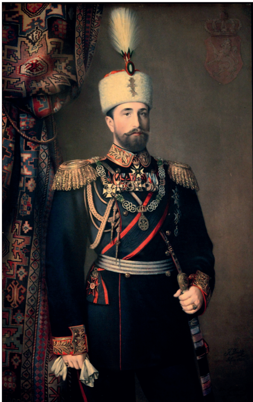
Княз Александър I Батенберг. Худ. А. Пьотровски