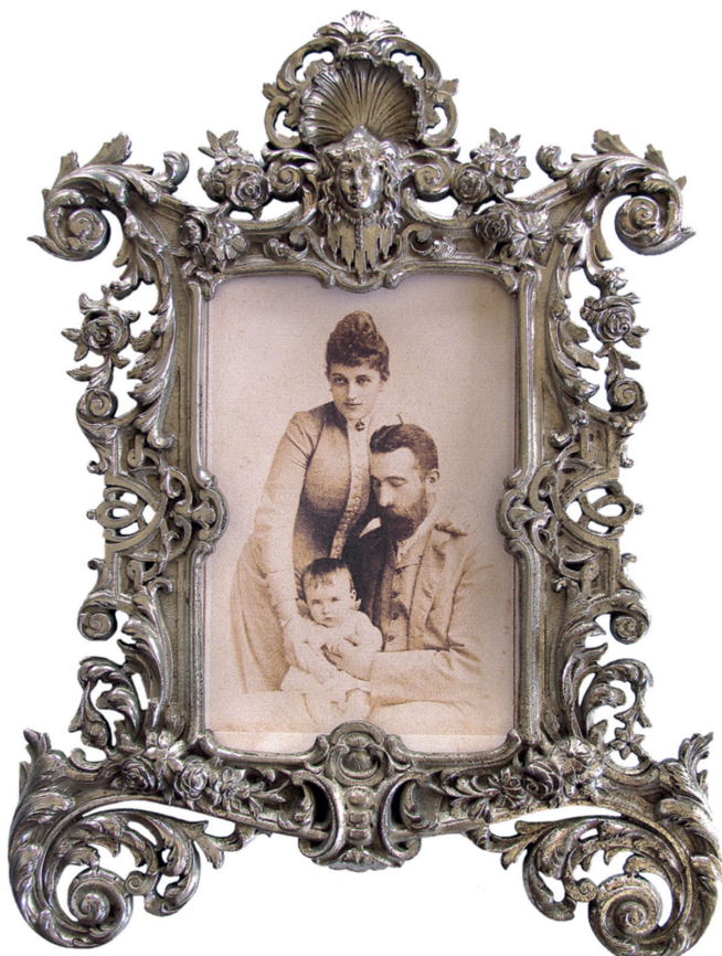
Княз Александър I Батенберг със съпругата си Йохана Хартенау и сина си Крум-Асен

– Княже, от днес ти не си вече глава на България. Подпиши, че се отказваш от престола!