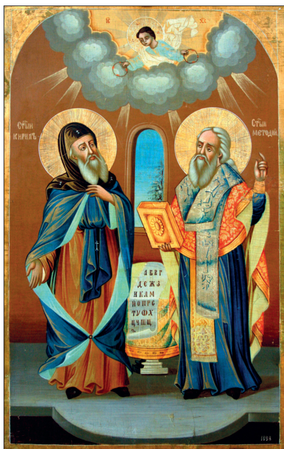
Светите братя Кирил и Методий, създатели на българската азбука

През следващите векове начело на царството стояли велики царе като хан Крум, който създаде първите писмени закони, княз Борис I Михаил, който през 864 г. покръстил българите в християнството и подкрепил делото на братята Кирил и Методий – създателите на славянската азбука. При цар Симеон Велики границите на българското царство достигнали до три морета – Черно, Бяло и Адриатическо. Но при неговите наследници – цар Петър I и цар Борис II – българската държава отслабнала и през 1018 г. била завладяна от Византия. Дошъл краят на