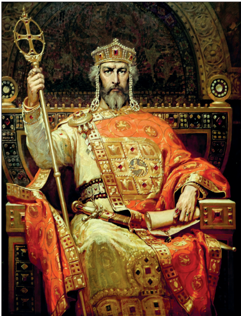
Цар Симеон Велики. Худ. Д. Гюдженов