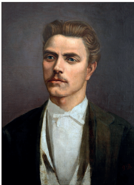
Апостолът на свободата Васил Левски – национален герой на България

Първото българско царство. За около два века българите нямали свое царство.