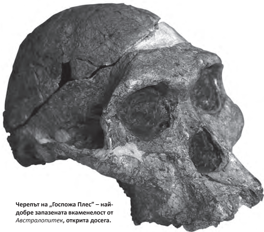
Черепът на „Госпожа Плес” – най-добре запазената вкаменелост от Австралопитек , открита досега.