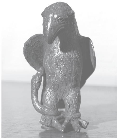
Слята се, че орелът е част от върха на паенено в бой византийско знаме. На върдите му е монограмът на Аспарух, а на крилата му - надпис „doux“.

Победата на българите над византийците в битката при Онгъла и последвалото завладяване на земите на юг от река Дунав са ключови събития, които предопределят бъдещето на Европейския югоизток.