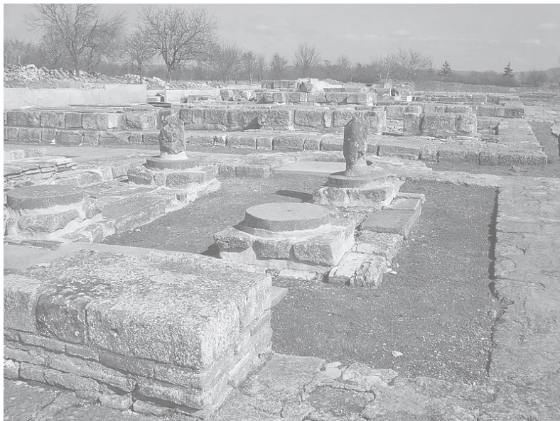
Изглед от останките на първата българска столица Плиска