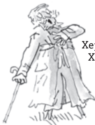
Херцогът на Хемпшир