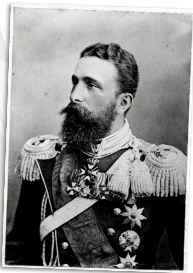
Княз Александър I, носещ знаците на първите степени на ордени „За храброст“ и „Св. Александър“

Началото е поставено със създаването на Военния орден „За храброст“, ордена „Св. Александър“, ордена „За заслуга“ и асоциирания към него медал „За заслуга“ и първите възпоменателни медали, например „За раздаване знамената на българската войска“, с които ще имаме възможност да се запознаем в детайли по-нататък в изложението.