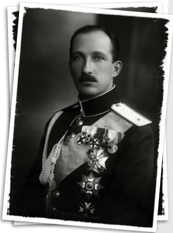
Цар Борис III, носещ знаците на Великия кръст на ордена „Св. св. равноапостоли Кирил и Методий“ и III степен I, II клас и IV степен на ордена „За храброст“

учредяват със закон и „се даряват само от Негово Величество Царя лично или по доклад на респективните министри“. Според чл. 5: „Всеки български гражданин – чиновник, офицер, войник, духовник или частно лице, както и всеки общественик – може да бъде награден с български орден за заслугите си към Короната и Отечеството, според длъжността, чина и положението си“. Правилникът остава в сила и се използва до преврата на 9 септември 1944 г.