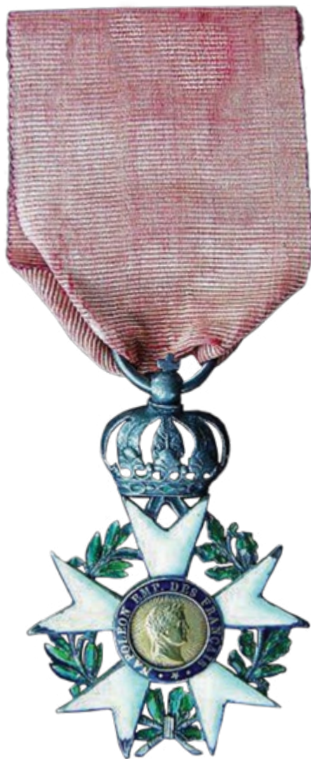
Орден на Почетния легион, Франция, емисия на император Наполеон I (носен в битка)

знака на ордена и огърлие, което се носи на раменете, или звезда, която се носи на гърдите, а по-ниските може да се разделят допълнително на класове, например за младши и старши офицерски състав.