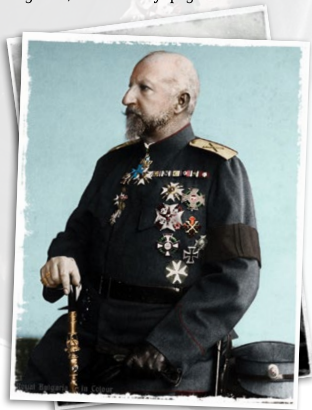
Цар Фердинанд I в маршалска униформа, носещ знаците на I степен на ордена „За храброст“ с черепи и кости и звезда на ордена „Св. св. равноапостоли Кирил и Методий“

През 1887 г. княз Фердинанд I създава възпоменателен кръст за своето възшествие, каквато е европейската практика. Този кръст носи символите на династията, от която князът произхожда, като цветове, герб и корона. През август 1891 г. той основава ордена „За гражданска заслуга“, изработен също по проект на Фридрих фон Розенфелд. Орденът носи короната и вензела на новия владетел, който го е учредил.