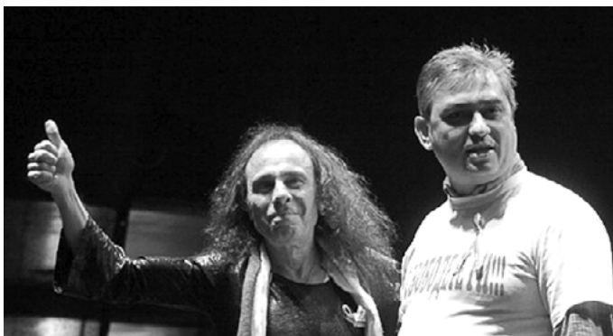
Дио на Нова година в Каварна, 31.12.2006 г.

Когато го изпращахме на летището, получих следващата голяма изненада: подари ми една много странна тениска – с неговия лик в красиво зелено, на черен фон, която, събирала слънчева светлина през деня, вечерно време светеше. Пазя си я и до днес. Та така. Това беше първата от ярките ми и незабравими срещи с Дио.