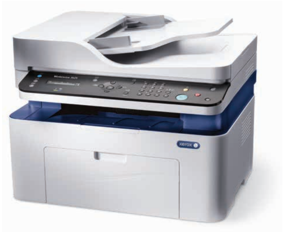
WorkCentre 3025. Копиране. Печат. Сканиране. Факс.*

* Факс и ADF (автоматично подаващо устройство) се предлагат само в WorkCentre 3025NI.