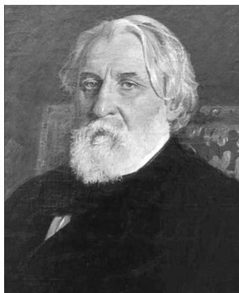
Иван Сергеевич Тургенев (1818 – 1883)

И. С. Тургенев е роден на 28 октомври 1818 г. в гр. Орел в богато дворянско семейство. Тургеневи живеят типичен за дворяните живот – богат, охолен, разточителен. Децата са били обучавани и възпитавани от гуверньори и гувернантки – предимно чужденци.