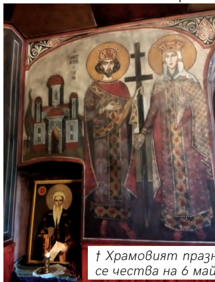
† Храмовият празник се чества на 6 май.

Днес в храма „Свети Георги Победоносец“ в кв. „Дървеница“ има изложена чудотворна икона на свети Лука Кримски. Смята се, че светецът помага за изцеляването