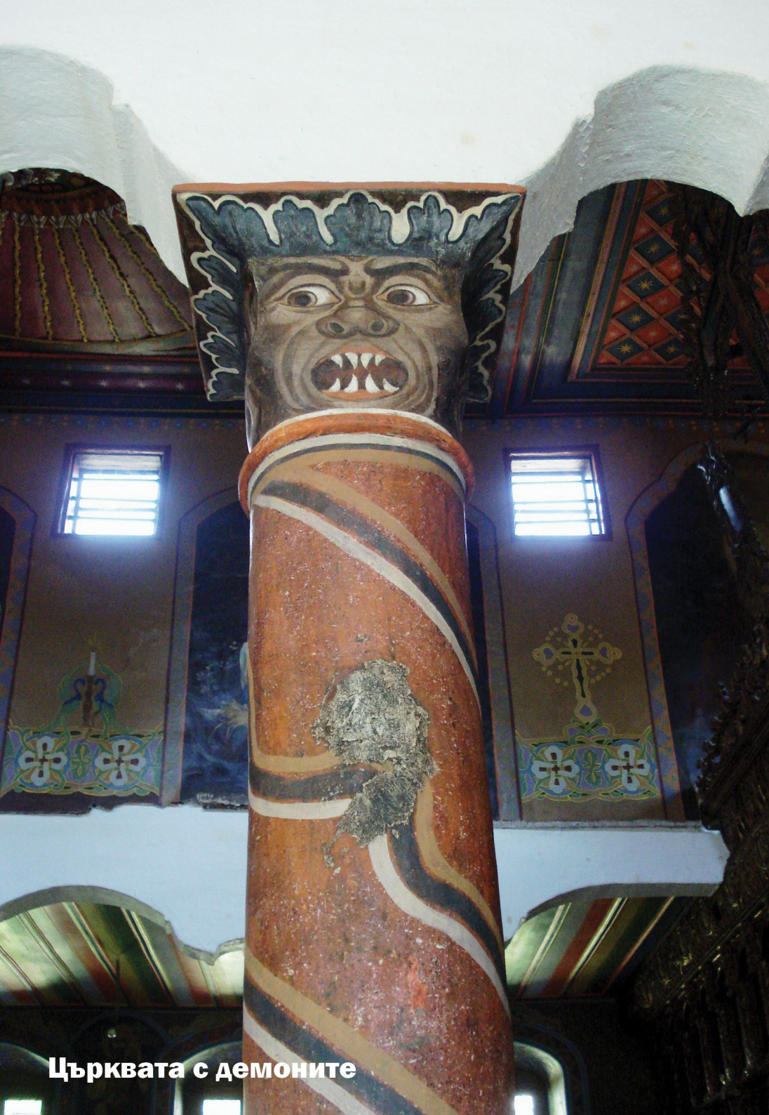
Църквата с демоните