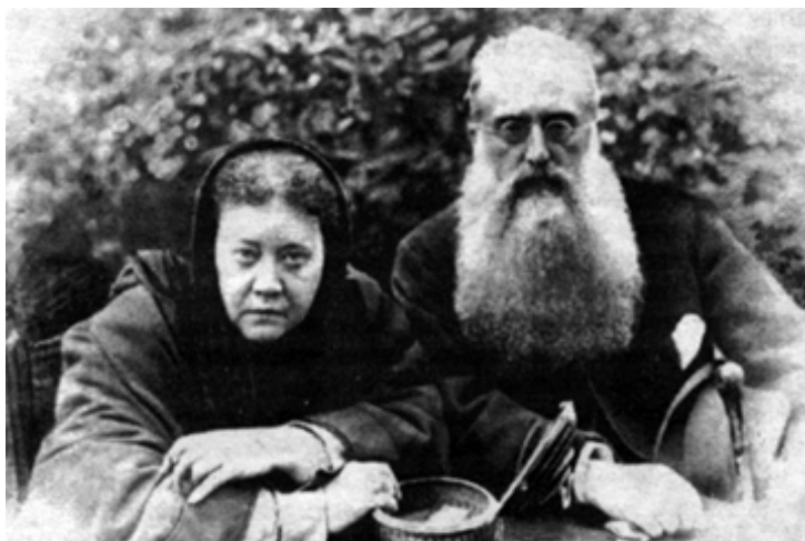
Елена Блаватска и Хенри Олкот, основатели на Теософско общество.

Палеофантастика била и книгата на новото „западно гуру“ Елена Блаватска, от която почерпих реконструкцията на света под управлението на Атлантида. Елена Блаватска се родила на 12 август 1831 година в град Екатеринослав. Баща ѝ принадлежал към рода на наследствените мекленбургски принцове фон Ротенщерн-Хан, а майка ѝ била внучка на княз Павел Василевич Долгоруки.