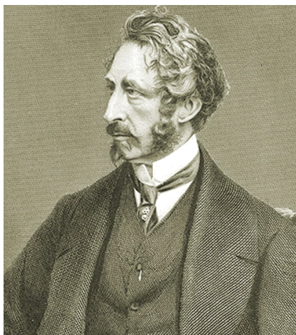
Английският писател Едуард Булвер-Литон, автор на романа „Бъдещата раса“.

да бяга под земята от настъпващия Потоп. Разбира се, тези същества (очевидно атлантите) донесли със себе си древна наука и древна традиция. Паметта за великото минало им позволила да създадат своеобразна утопия. Там напълно била ликвидирана бедността. Придобиването на силата врил премахнало войната, доколкото всяко дете можело да унищожи най-мощната крепост, и на враждуващите семейства се наложило да изработят правила, според които те (децата с крепостите) да могат да живеят в мир. Мощната социална забрана на убийството повлякла след себе си масово вегетарианство. Отказът от пряко физическо насилие свел ролята на държавата до обслужващ институт, който се използвал от семействата само за решаване на глобални проблеми (например осигуряване на светлина, което под земята било жизнено важно). Тъй като нямало престъпност, нямало нужда от съдебна и изправителна система. В семействата съществувал ръководен принцип: „Оставай с нас или си отивай, ако не ти харесват нашите обичаи и порядки“. При липсата на държавен диктат „всеки се занимавал с любимата си работа и живеел според своите наклонности, без да събужда нечия завист или стремеж да го надмине“.