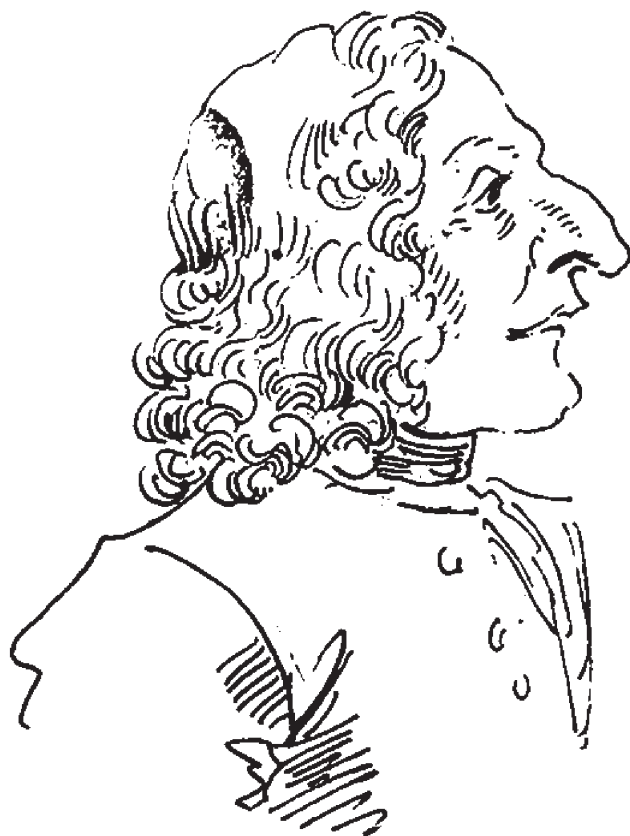
„Рижият свещеник“ – шарж на Вивалди от Пиер Леон Геци, 1823 г.