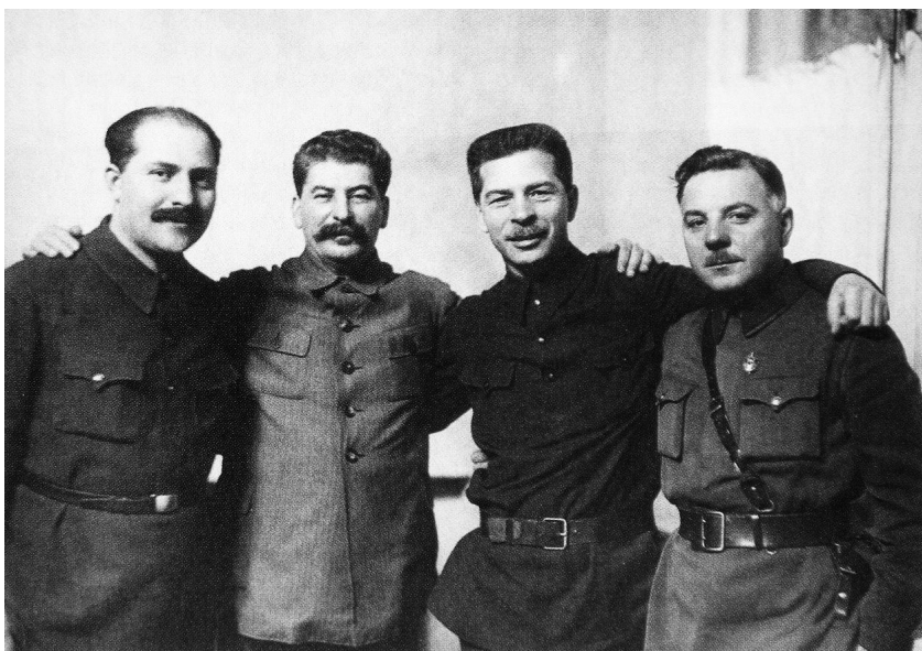
(От ляво надясно) Каганович, Сталин, Постышев, Ворошилов, 1934 г.

На Сталин му трябвало дълго време да установи пълен контрол над Червената армия. За тази цел той прибягнал до политиката „разделяй и владей“. Троцки бил свален от поста председател на Революционния военен съвет и нарком (народен комисар) по военните и морските работи и заменен с Михаил Фрунзе. Но и тази фигура се струвала на генералния секретар неподходяща, той се нуждаел от човек, напълно лишен от военни дарования, но който същевременно да бъде проводник на неговата политика в Червената армия. Затова, когато Фрунзе неочаквано умрял след неуспешна операция,