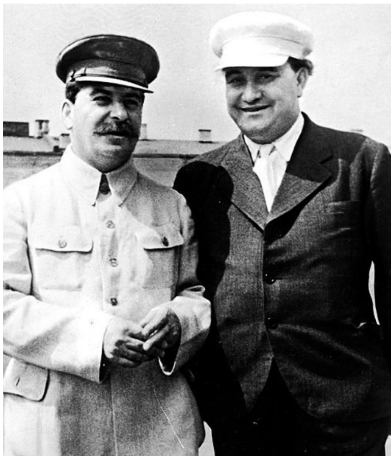
Йосиф Сталин и Георги Димитров се отправят на физкултурния парад на Червения площад, 1936 г.