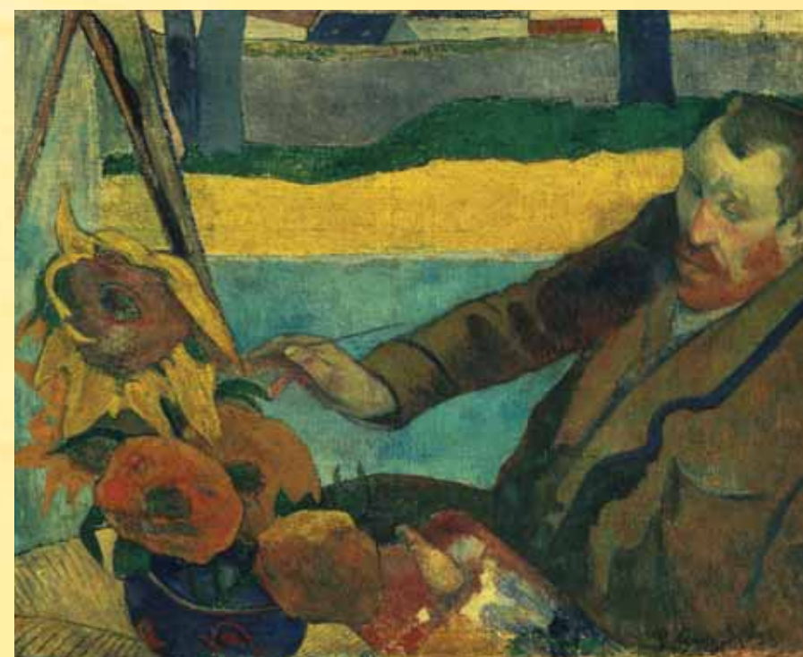
Гоген създава Ван Гог рисува слънчогледите през ноември 1888 г. Той използва маслени бои върху платно с размери 73x91 см.

Тази картина на Гоген изобразява Ван Гог по време на работа над едно от платната със слънчогледите. Гоген едва ли е наблюдавал това в действителност, тъй като по времето, когато той е в Арл, те не са цъфтели. Но Гоген обичал да рисува по спомен и въображение, обратно на Ван Гог, който предпочитал да рисува от натура.