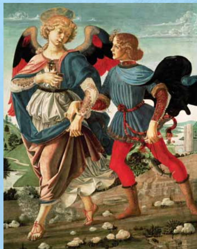
Тобиас и Ангелът е илюстрация към известната библейска притча за Ангела, който разкрил на едно момче тайната как да излекува баща си от слепота. Картина е изработена от италиански художници през 1470 г. и е с размери 84x66 см.

Връзка с интернет На адрес www.usborne-quicklinks.com може да намерите препратки към интернет-страници с игри за изкуството и да научите повече за музеите.