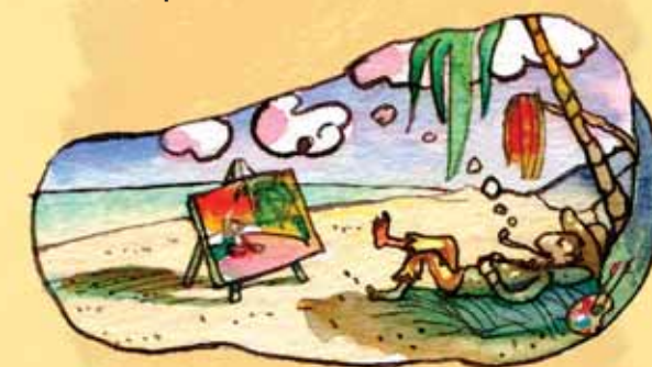
Гоген живял 12 години на Таити, където създа семейство и рисувал.

Пол Гоген е роден във Франция през 1848 г. Преди да стане художник, той работил като моряк и борсов посредник. Хората днес се възхищават на неговия стил, но приживе той с мъка се изхранвал с изкуството си. Гоген умира на остров Таити през 1903 г.