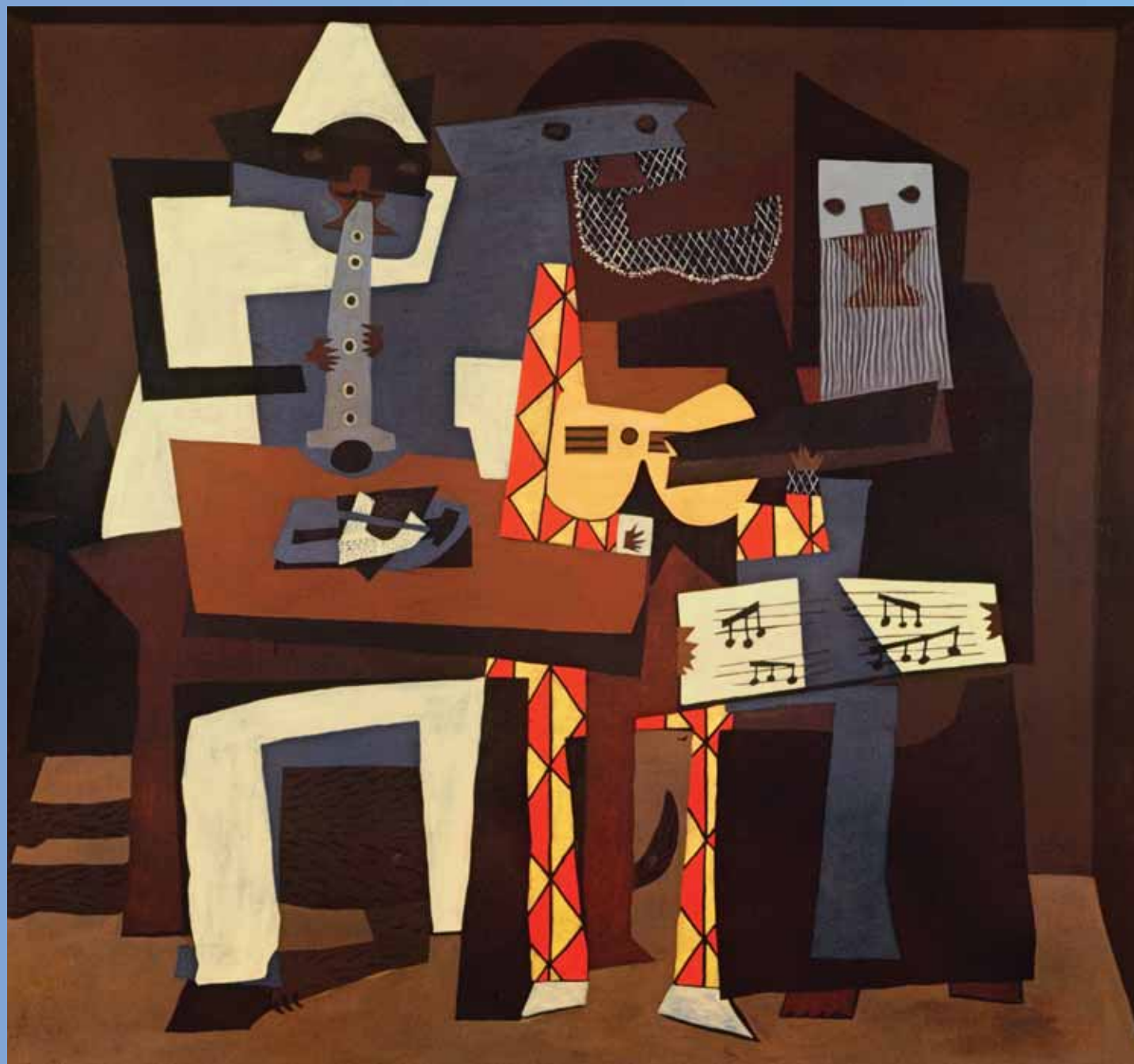
Пабло Пикасо рисува Тримата музиканти през 1921 г., като използва маслени бои върху платно с размери 201x223 см.

Тази колоритна картина представя трима музиканти, облечени в стари театрални костюми. Вляво седи кларинетистът, облечен в бял костюм на клоун, а зад него е застанало едно куче. В средата седи китаристът, облечен като арлекин. Вдясно е певецът, облечен в расо на монах.