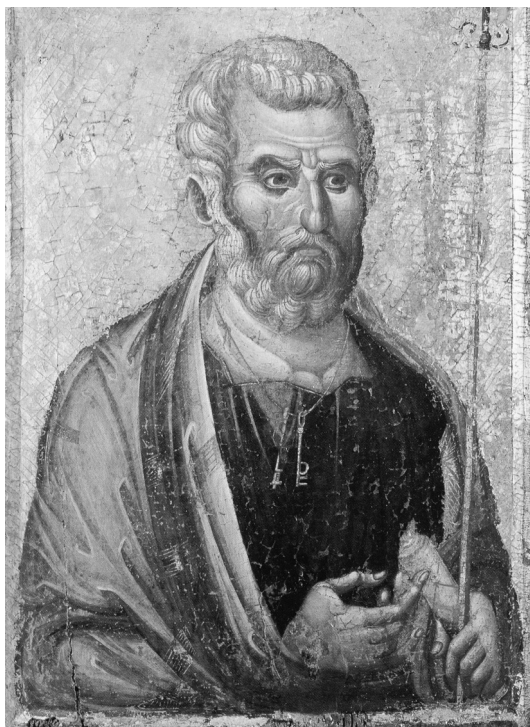
Апостол Петър. Византийска икона, XIV век

Апостол Петър е последовател на учението на Иисус Христос, един от неговите дванадесет апостоли. Личността на човека, получил при раждането си името Симон, не се отличавала с нищо забележително. Преди да срещне Иисус, той се занимавал с риболов, което носело на семейството му много скромен доход.