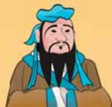
Право и принципи на управление въз основа на учението на Конфуций