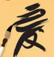
Калиграфия, музика и поезия