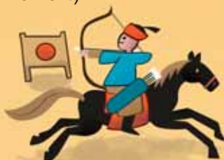
Конна езда и стрелба с лък

Изпитите за шънюен се провеждали всяка година във всички окръзи. След дългогодишно обучение успешните кандидати държали изпитите дзюджан , които се провеждали на три години в окръзите. Тези, които искали да растат в чиновническата йерархия, трябвало да се явят на изпитите дзиншъ .