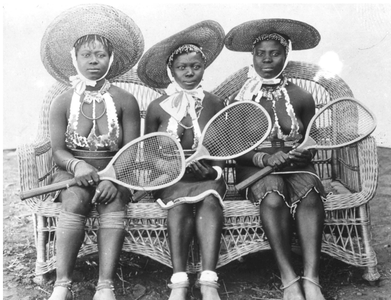
Тенисистки от племето Зулу. Началото на XX-ти век.

Първоначално в тениса не се използва клей. Благодарение на многократните победители от Уимбълдън обаче, братята Уилям и Ърнест Реншоу, това покритие получава разпространение. Братята често ходят на почивка в Кан и построяват там корт. Той е, разбира се, тревен. Но в южната част на Франция тревата изсъхва много бързо поради жегата. Братята намират изход от това. Те надробяват бракувани теракотени съдове и поръсват корта с полученото покритие. Вероятно и самите Реншоу не очакват доколко това ще промени света на тениса. Тяхното покритие започва да се използва навсякъде, където е горещо.