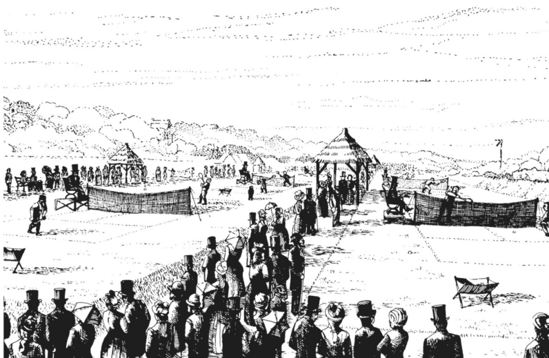
Първият турнир по тенис на трева във „Всеанглийския клуб по лаун тенис и крокет“ – Уимбълдън. Юли, 1877 г.

На турнира се записват 22 души, един от които в крайна сметка се отказва от участие. Организаторите пропускат факта, че състезателите трябва да бъдат четно число; в резултат на това един от тенисистите, които достигат до полуфиналите, просто няма противник и продължава напред служебно. Правилото, че винаги трябва да има четирима играчи на полуфиналите, осем на четвъртфиналите и т.н., е прието едва през 1885 г. Шампионската титла в дебютното издание на Уимбълдън е завоювана от Спенсър Гор. Интерес предизвиква фактът, че през следващата година Спенсър губи в мача за титлата от Франк Хадю, който толкова не харесва тениса, че го нарича „жен-