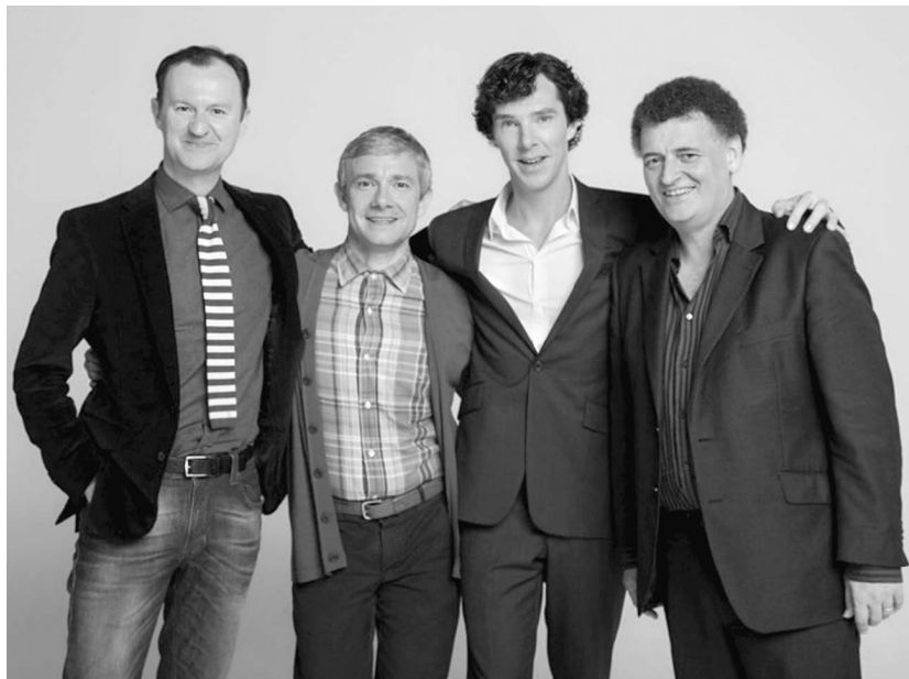
Марк Гатис, Мартин Фрийман, Бенедикт Къмбърбач и Стивън Мофат.

ставял като някой свален летец. Бил е опасен млад мъж, който сътворява истински съвременни дела в Лондон.“