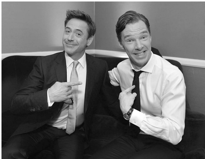
Бенедикт Къмбърбач срещу Робърт Дауни Джуниър.