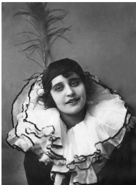
Стара фотография с лика на актрисата