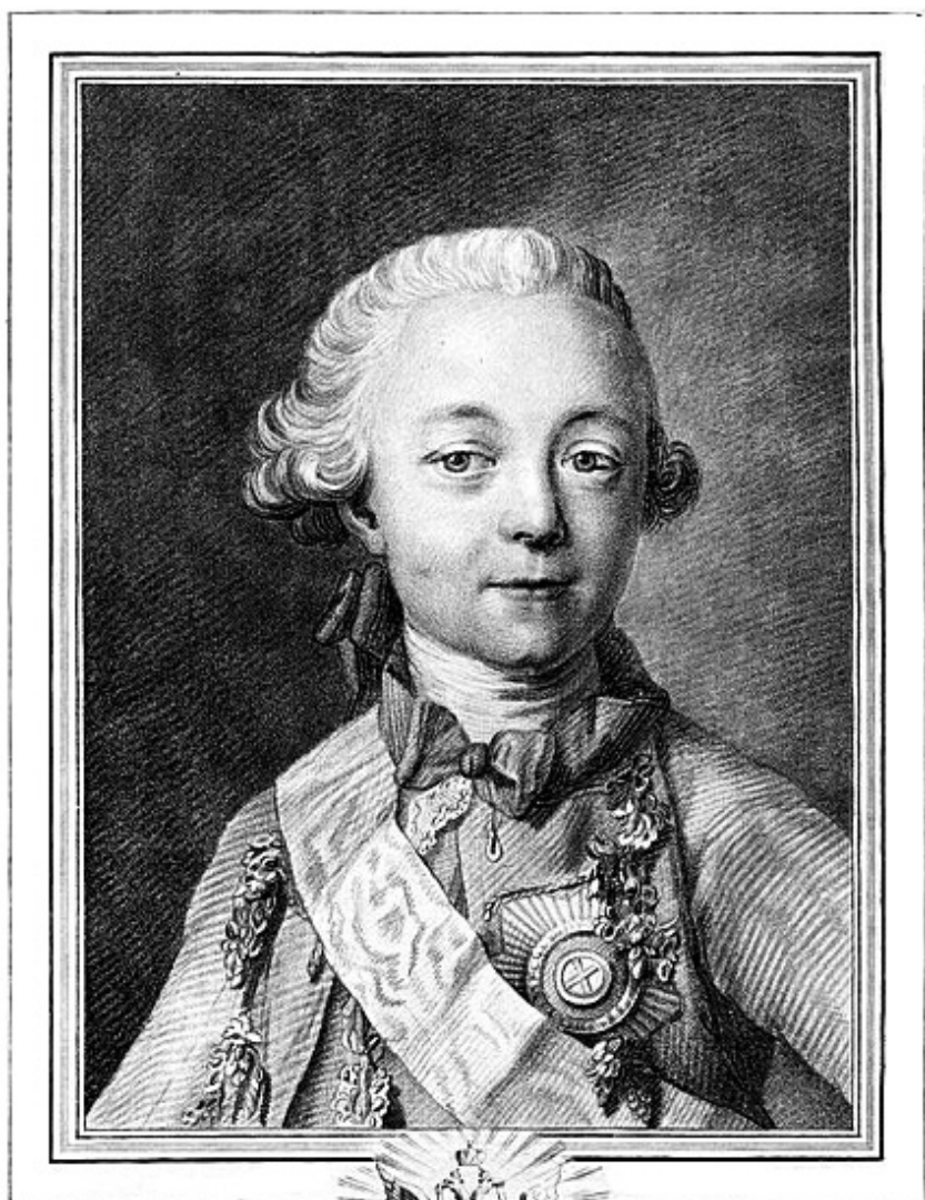
ПАВЕЛЪ ГОСУДАРЬ ЦЕСАРЕВИЧЪ НАСЛЕДНИКЪ