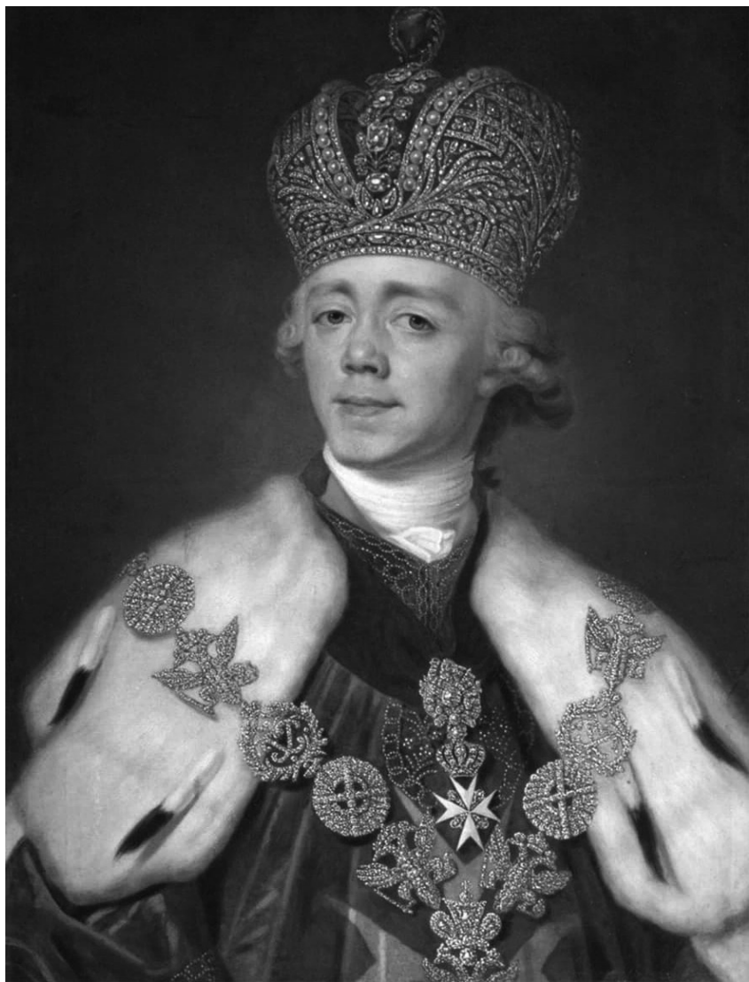
Портрет на руския император Павел I. Художник Владимир Боровиковски. Музей на Академията на изкуствата, Санкт Петербург