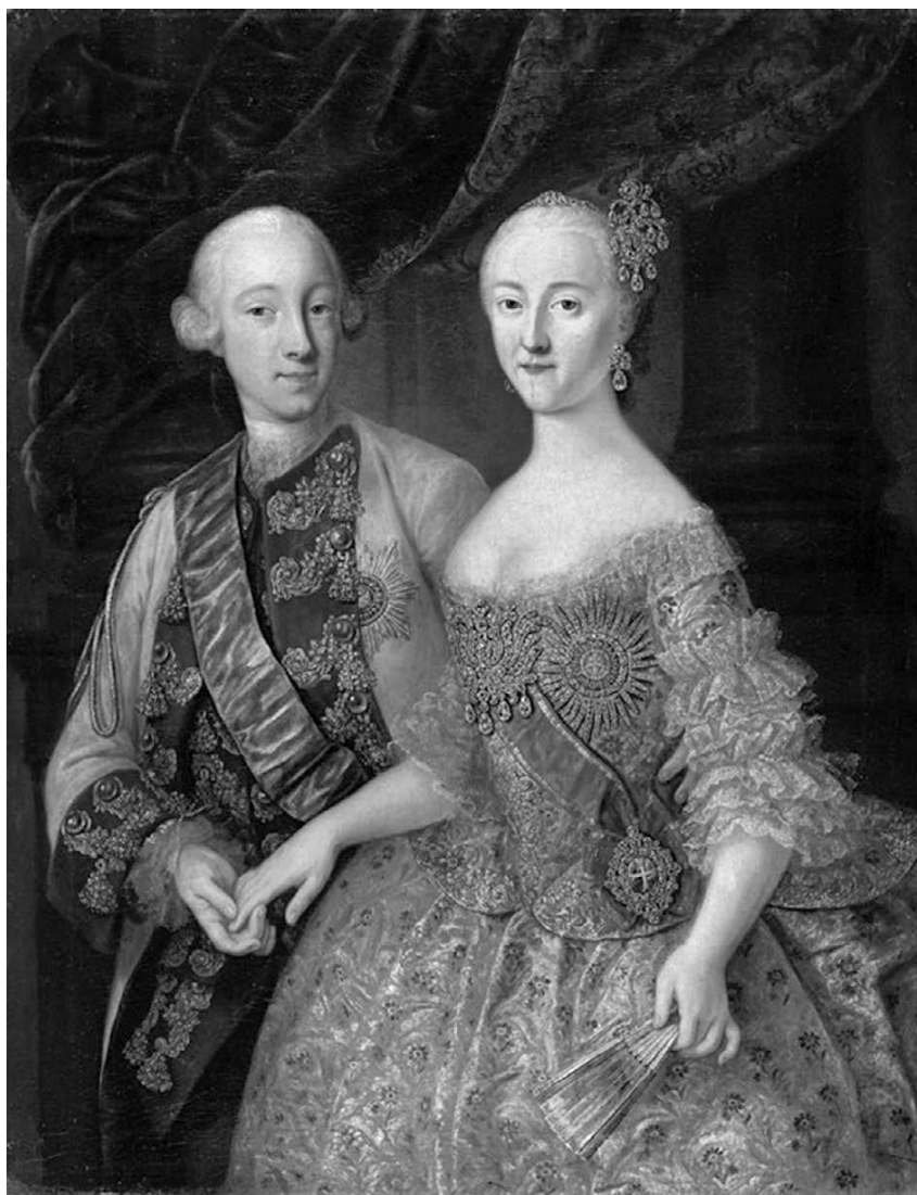
Великият княз Петър Федорович и великата княгиня Екатерина Алексеевна, художник Георг Кристоф Грут, 1740 г.