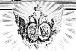
ПЕТРОВИЧЪ И ВЕЛИКИЙ КНЯЗЬ РОССІЙСКИЙ

Павел Петрович, суверен, наследник и велик княз