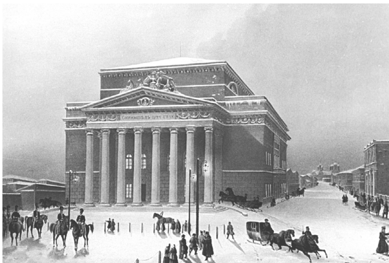
Болшой Петровски театър

Нарекли театъра Болшой Петровски. Тържественото откриване се състояло на 6 януари 1825 год. с представление на балета на испанския композитор Фернандо Сора „Сандрильона“ (Пепеляшка), а в началото на спектакъла зрителите приветствали с овации Бове, създал във възродена Москва едно истинско чудо – един необикновено величествен театър.