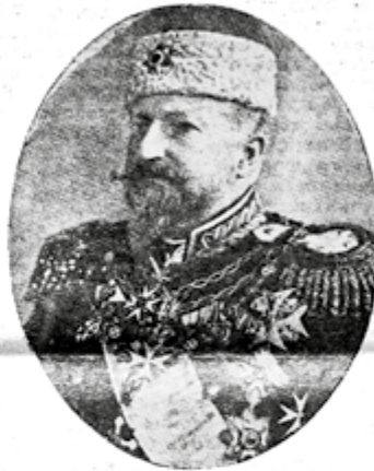
Н. В. Царь Фердинандъ I. — главнокомандующъ.