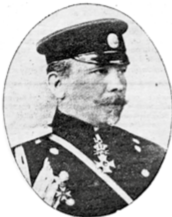
Генер. Савовъ — пом. главнокомандующъ.