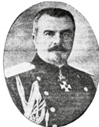
Генер. Фичевъ — н-къ Щаба на действ. армия.