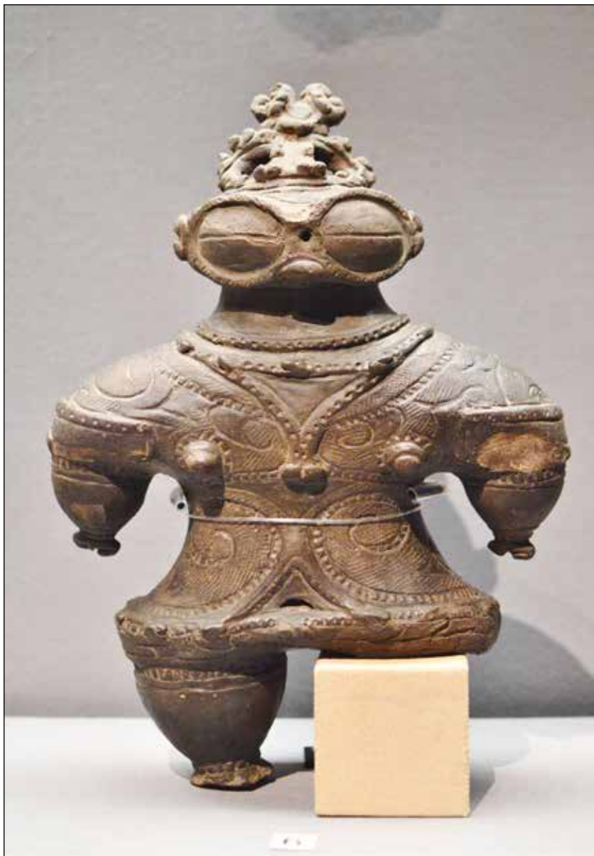
Статуетка догу от късния Джомон 青森県つがる市木造亀ヶ岡出土 遮光器土偶-2.jpg

При много статуетки предназначението трудно може да бъде определено. Такъв е случаят с показаната по-долу статуетка на жена с изпъкнали очи, наподобяващи зърна на кафе (coffee bean eyes).