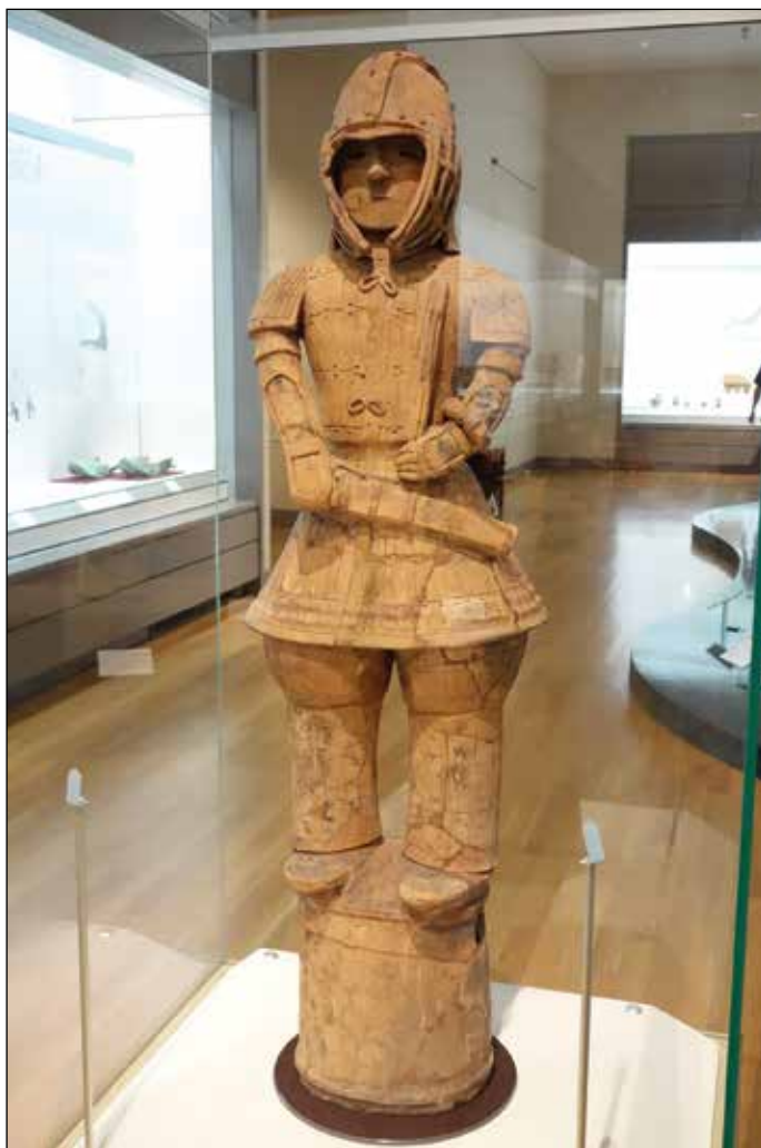
Воин с доспехи, меч и лък

Фигурата е висока 131,5 сантиметра. Обявена е за национално съкровище и е изложена в Токийския национален музей. Датирана е от VI век.