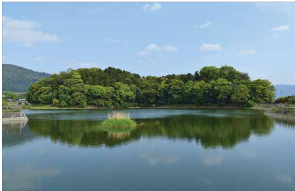
Надгробната могила Хашихака

Статуетките ханива са пряко свързани с големите надгробни могили (кофун), дали названието на историческия период Кофун. Най-голяма е надгробната могила на император Нинтоку (упр. 313 – 399), а най-стара – надгробната могила Хашихака, намираща се в района на град Сакураи, префектура Нара. Според най-новата датировка тя е изградена през 248 година.