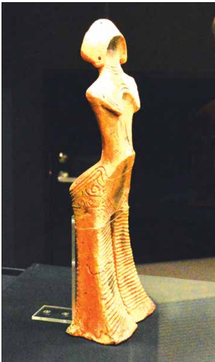
Женско божество от Джомон

Следващата статуетка е известна като „Женско божество от Джомон“.