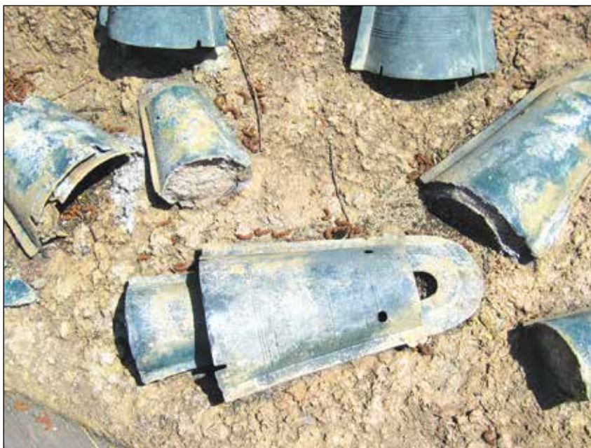
Част от находката от бронзови камбанки в Камо-ивакура Doutaku in Kamoiwakura ruins.jpg

Тук е показана част от най-голямата находка от бронзови камбанки, намерени при разкопките в Камо-ивакура, префектура Шимане.