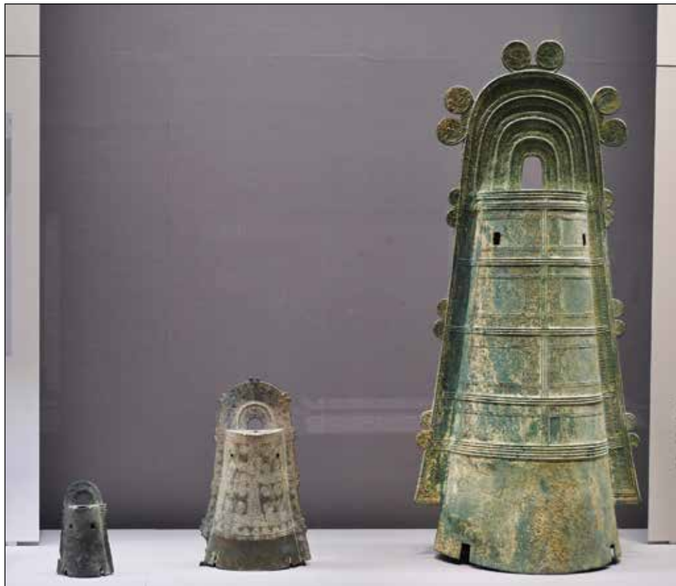
Камбанки, изложени в Токийския национален музей

Както се вижда и от фигурата по-долу, камбанките се отличават с голямо разнообразие както по дизайн, така и по размери.