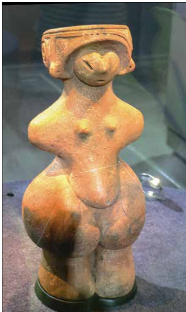
Венера от Джомон

Сред най-известните догу е статуетката „Венера от Джомон“ (Jōmon no Bīnasu). Открита е през 1986 г. и е датирана от Средния Джомон. През 1995 г. е обявена за национално съкровище. Висока е 27 см и тежи 2,14 кг.