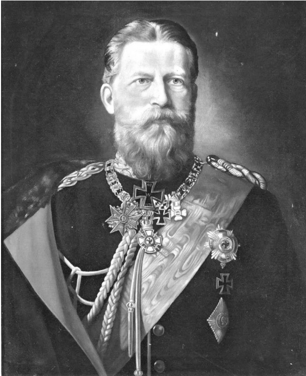
Фридрих III (1831–1888) – германски император (кайзер) и крал на Прусия от 9 март 1888 година, пруски генерал-фелдмаршал (28 октомври 1870 г.), руски генерал-фелдмаршал (1872).

като стават имперски провинции, Елзас и Лотарингия фактически се оказват под контрола на Прусия, тъй като първоначално се управляват от обер-президент, подчинен на имперския канцлер и назначен от императора, а от 1879 година от назначен от императора наместник (щатхалтер).