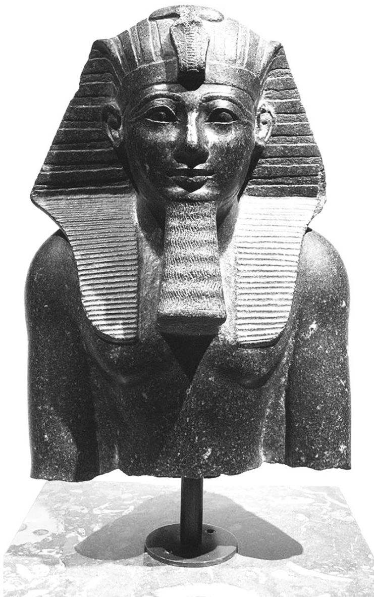
Мраморен бюст на фараон Тутмос III