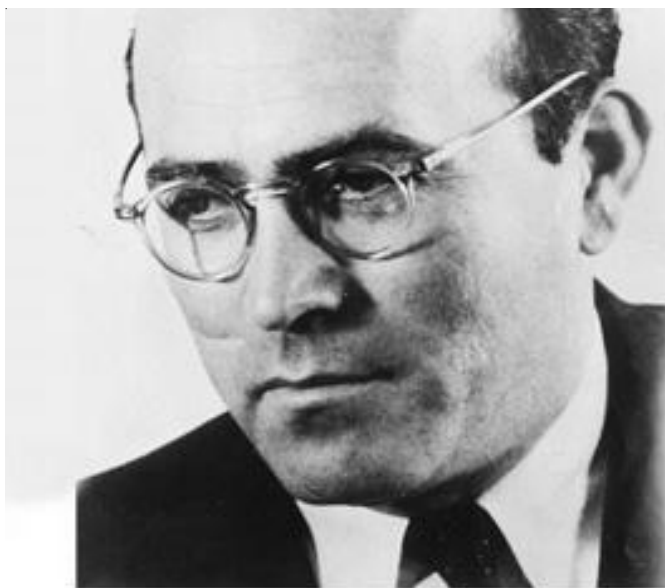
Рувен Шилоах – първият директор на МОСАД (1948-1952)

си той така и не правел разлика между кошерна 1 и некошер-на храна. След като се скарал с баща си, въпреки волята му постъпил в Ерусалимския университет. Независимо от твърде свободното си отношение към юдаизма младият студент бил пламенен еврейски националист и мечтаел за възсъздаване на Израел. Тези убеждения го отвели в "Хагана", тайната въоръжена организация на ционистите 2 .