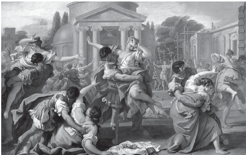
„Отвлечането на сабинянките от римляните“. Себастиано Ричи, ок. 1700 г. Музей Лихтенщайн

жище – в древното разбиране на този термин (което впрочем не се различава особено от днешното).