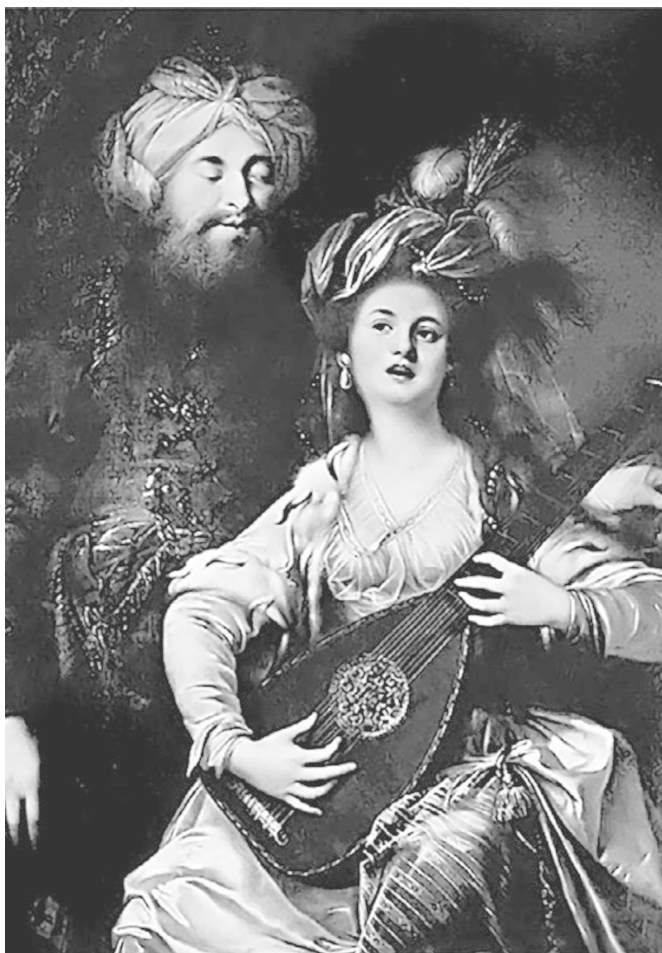
Заради лекия нрав и любовта ѝ към музиката я нарекли „Хюрем“ – веселата, худ. А. Хикел, 1780 г.

Те говорели за всичко – политика, изкуство, любов, и често общували чрез стихове.