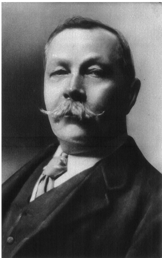
Артър Конан Дойл (1859 – 1930)