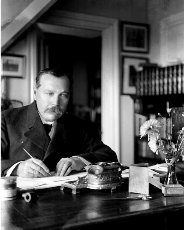
Артър Конан Дойл в процеса на творчеството.

В мемоарната си книга „Спомени и приключения“ (Memories and Adventures) Артър Конан Дойл с известно самочувствие отбелязва, че може да проследи родословното си дърво петстотин години назад. В „Английски биографичен речник“ представителите на Дойл от преди пет столетия не се споменават, а първият, който влиза между страниците