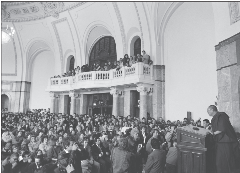
Н.Св. Далай Лама в Аулата на Софийския университет „Св. Климент Охридски“.

За жалост в нашето едва събуждащо се тогава гражданско общество нямаше ясна представа за съдбата на тибетския народ и ролята на неговия духовен и светски водач Далай Лама. Тибетците се надяваха на външно-политическа подкрепа от българския народ и българския президент, а бълга-