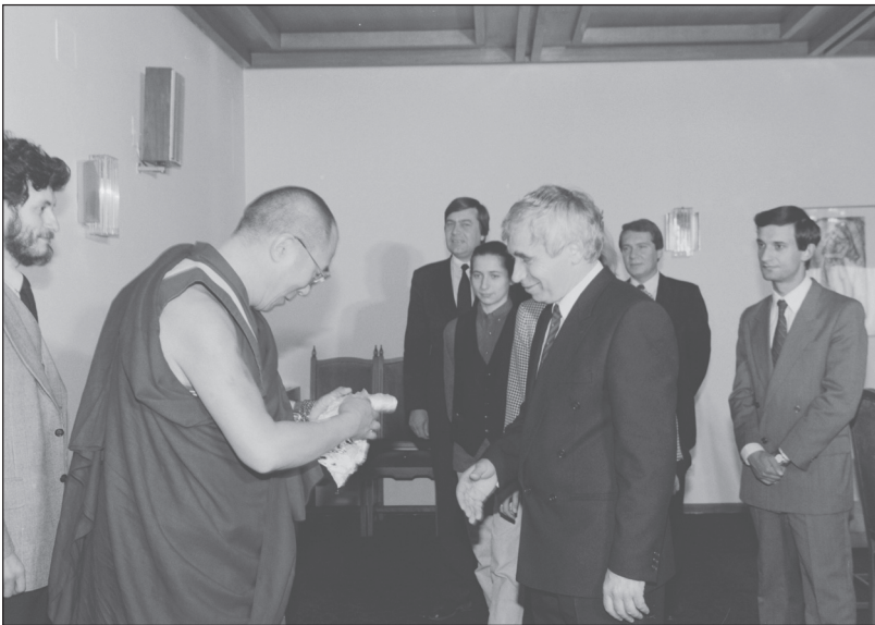
Среща между Н.Св. Далай Лама и президента Желю Желев.

През 1989 и 1990 г. тази идея изкристализира и доби съвсем реални очертания след направените контакти от тибетската страна с Георги Свечни-