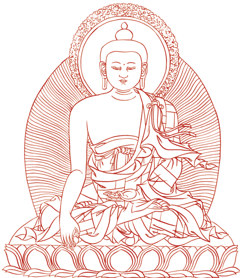
Буда Шакямуни. Рисунка: Людмила Класанова