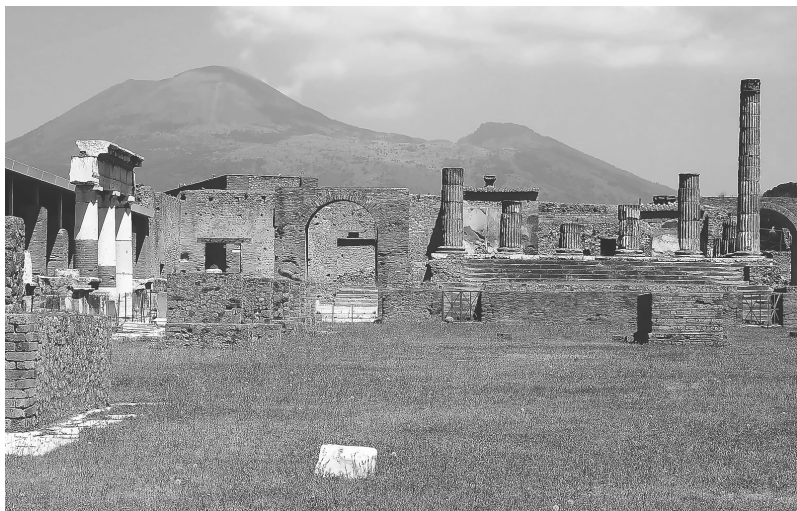
Руини от храма на Юпитер на фона на страховития Везувий

Крайбрежието на Неаполитанския залив, заобиколено на северозапад от островите Иския и Прочида и от хълмовете на Флегрейските (Пламтящите) полета, на североизток от залива – от планината Сомма и на югоизток – от планините на полуостров Соренто и от остров Капри, от древни времена било примамливо място за заселване. Благодатният климат, плодородните земи, лазурното море с неговите дарове, търговските морски маршрути и пътищата към Рим, на изток и на юг на Апенинския полуостров – всичко това привличало хората тук. Те се заселвали по крайбрежието, създавайки нови градове и селища. Така възникнали Неапол, Херкуланум, Помпей, Стабин и др.