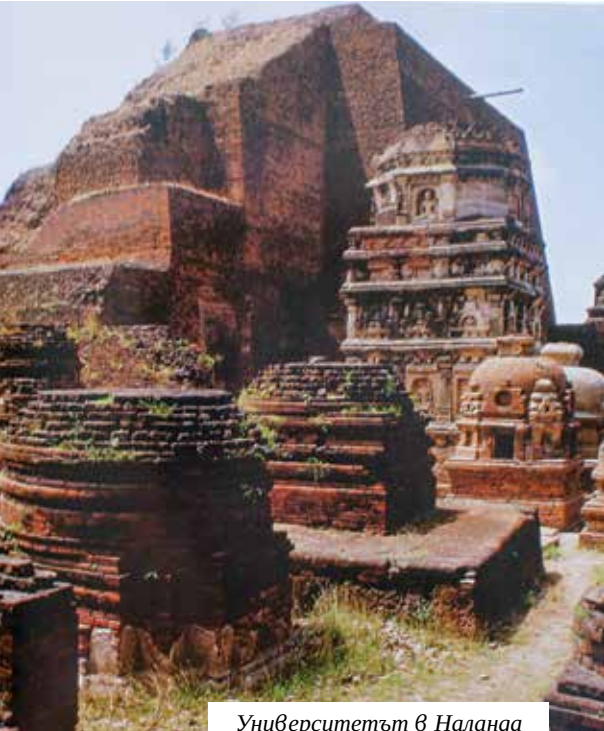
Университетът в Наланда

И първият университет в света – на Такшашила, е построен в Индия през 700 г. пр. Хр.