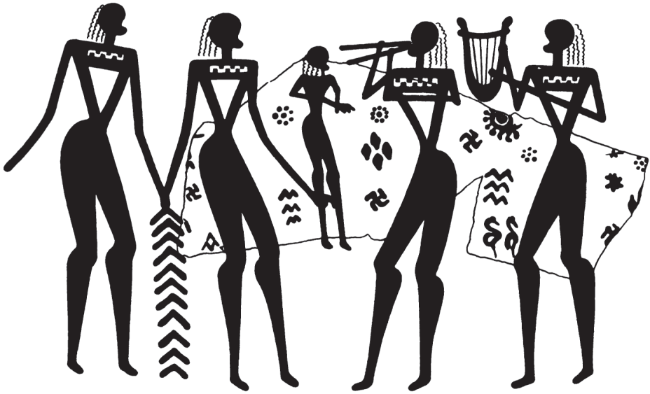
Фиг. 7. Сцена, изобразена върху геометричен съд, от агората в Атина

нове на общността, но е сигурно, че условията са били много различни във всеки град, според големината и броя на малките поземлени области и силата на съответните местни аристокрации и системи, притежаващи подчинени селяни, където гражданите са били малцинство. Гърците никога не са се колебали относно спецификата на тяхната система. Те са тези преди всичко, които са живели в „град държава“ ( polis ) за разлика от останалия свят. Разнообразието на ситуациите не е представлявало пречка за дълбокото единство на системата, която остава единствена по рода си в историята.