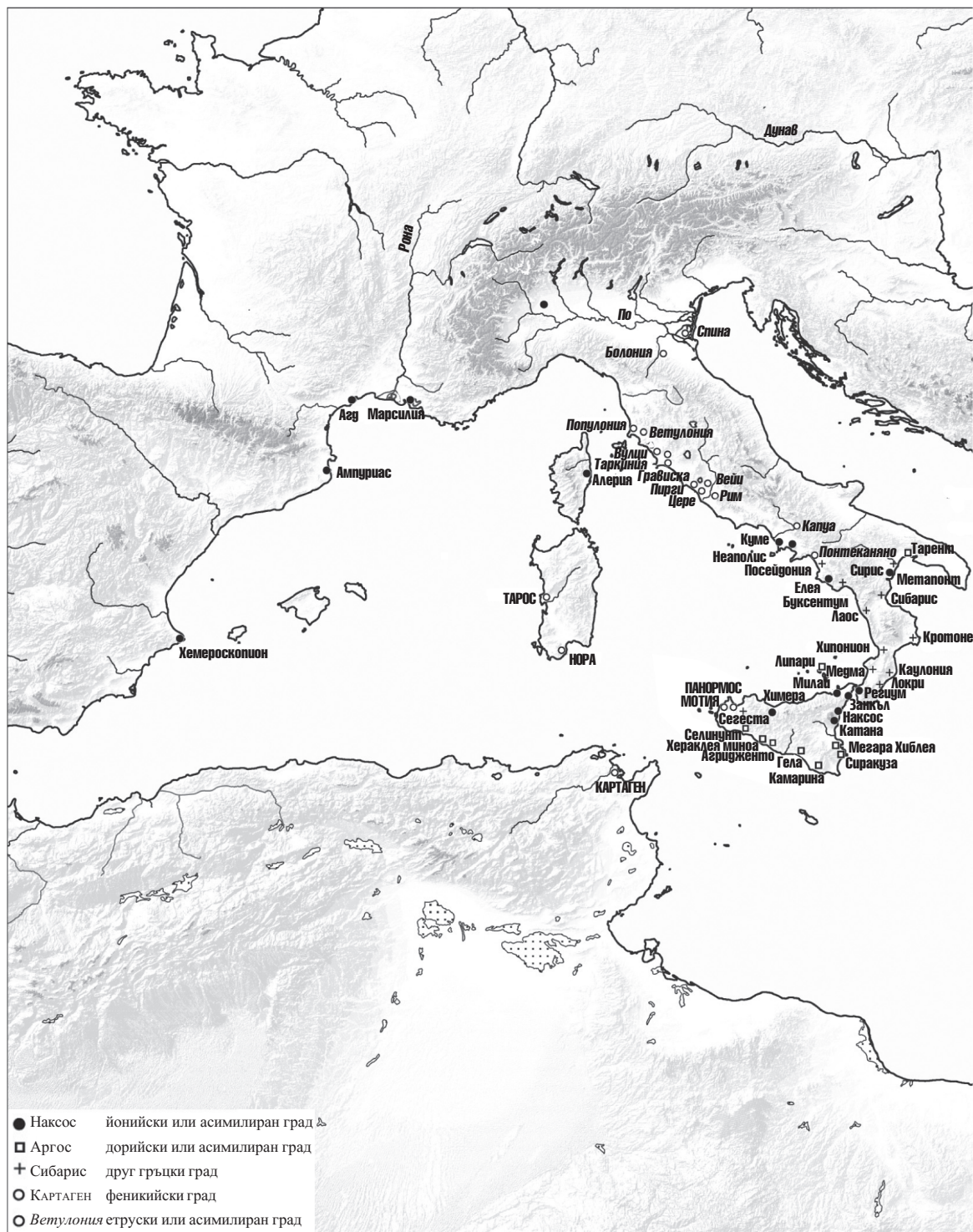
Карта 5. Гръцката експанзия в края на VI век пр. Хр.