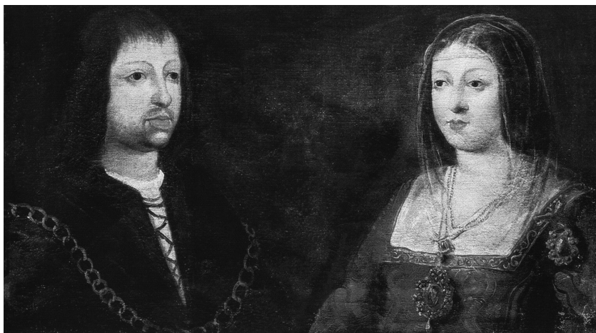
Сватбен портрет на крал Фердинанд и кралица Изабела. Неизвестен автор

монарсите в един лагер под стените на Гранада, в разгара на последните дни на Реконкистата 2 . Моментът се оказал неподходящ, кралицата си взела думите обратно. Тя можела да бъде разбрана: в този момент най-лесният начин да даде пари на Колумб бил да заложил скъпоценностите си (кралската корона вече била заложена заради войната). Отчаян, Колумб решил през октомври да замине за Франция. Вече десет години той търсел средства за плаването и всеки път или му отказвали, или казвали „утре“. Той отишъл в любимия си манастир Ла-Рабида, където имал доста приятели, за да се сбoguва с тях. Там бил и Фрай Хуан Перес, бившият духовник на кралицата.