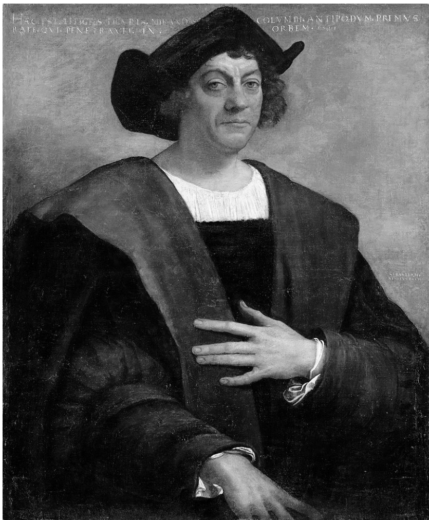
Възможен посмъртен портрет на Колумб от художника Себастьяно дел Пьомбо, 1519 г.