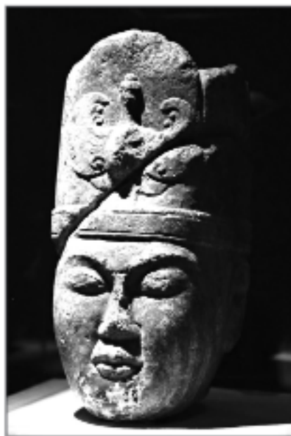
Глава на тюркския вожд Кул Тегин (684 – 731)

Тюрките познават преди европейците хартията и техниката на печатането. Благодарение на контактите и културния диалог с китайци и араби те използват тези открития през VIII – IX в. Хартията, която арабите пренасят в Испания и Европа (XI в.), се изработва още през VIII в. в Самарканд – Средна Азия. В началото на VIII в. Самарканд попада под арабски контрол. Легендата разказва, че по време на управлението на Абасидите през 751 г. двама китайски затворни-