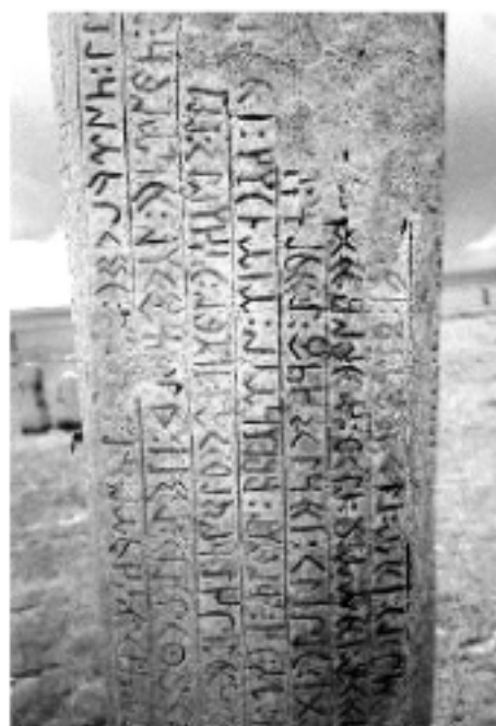
Старотюркска (Орхонска азбука) (725 – 735)

Тюрките принадлежат към урало-алтайската езикова общност. Писмената им култура съществува от началото на VIII в. Образци от нея са открити (1889 г.) върху писмени паметници в долината на река Орхон 1 . Те са разшифровани за пръв път през 1893 г. от датския лингвист и историк Вилхелм Томсен (1842 – 1927). От едната страна плочите са изписани с китайски йероглифи, а от другата – с тюркски знаци. Текстът е от времето на Втория тюркски хаганат (682 – 744) и възхвалява управлението на вождовете Билге Каган, Кюл Тегин и Тонюкук. Старата тюркска писменост е сродна на руническата и е съставен от 38 букви. Тази писменост е известна като Орхонска азбука. Към