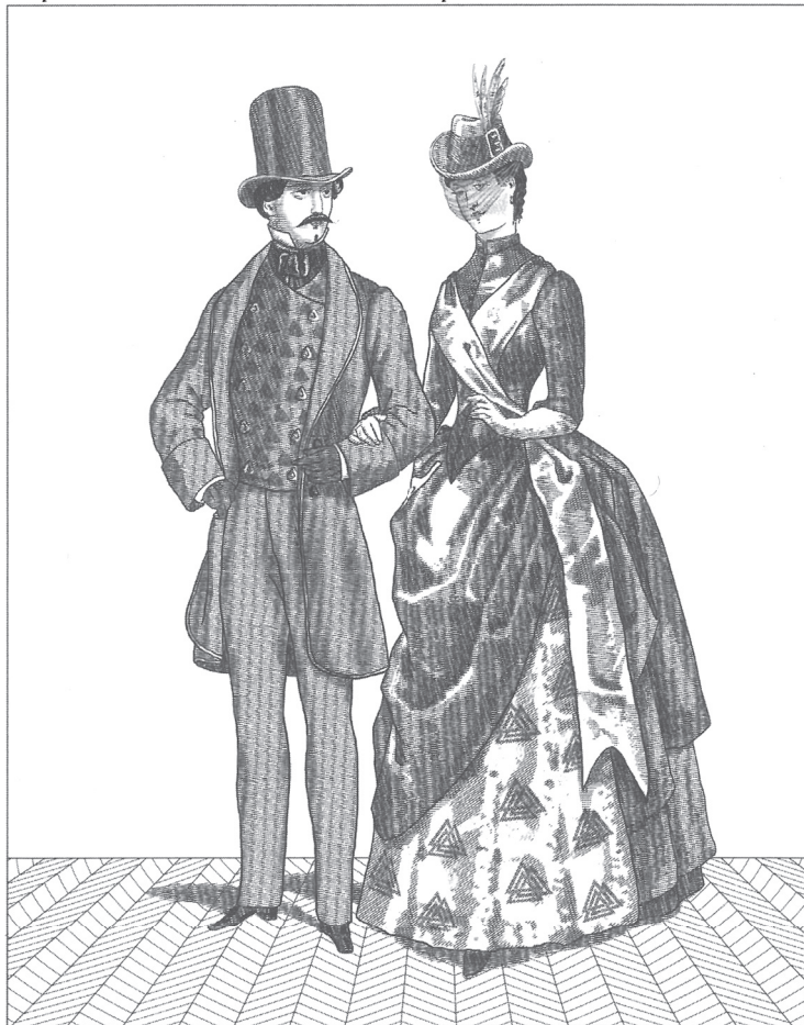
Дизайнер: Розинин Нобел, Виси моделер в модна къща „Уърт“; заимствано от „Плътонистки модни тенденции“ в сп. „Модни сезони“, лято 1003 г.

Живот-в-норма е ФундаМентФашисткия режим на хранене и начин на живот, замислен да премахне токсините от тялото и така да пречисти Кристализирания астрален етер. Затова облеклото е скромно и покрива изцяло тялото, като цели да прикрие, обуздае и потисне инстинктивната похотлива природа на мъжете и (преди всичко) на жените.