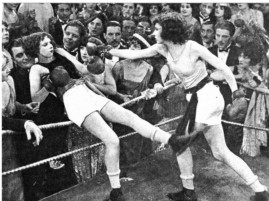
Женски бокс от началото на XX век

В края на XX век започва активното развитие и на женския бокс. През 2012 г. женският бокс също е включен в програмата на Олимпийските игри. Това разширява границите на популярността и развитието на бокса като спорт за жени.