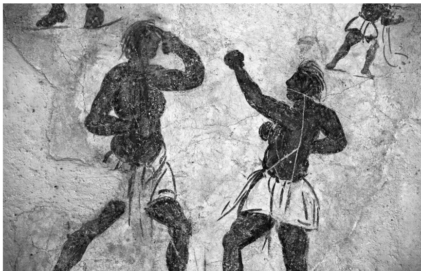
Първите олимпийски шампиони по бокс

Боксът е един от най-древните и популярни спортове в историята на човечеството. Съчетавайки в себе си физическа сила, техника, стратегия и елегантност, класическият бокс печели сърцата на поколения почитатели по целия свят. Когато обърнем поглед назад във времето и разгледаме в детайли етапите, през които преминава развитието на този спорт, както и произхода му, след като се запознаем с неговите основатели и с личностите на първите боксьори, ще разберем защо влиянието на този спорт върху съвременния свят е толкова голямо.