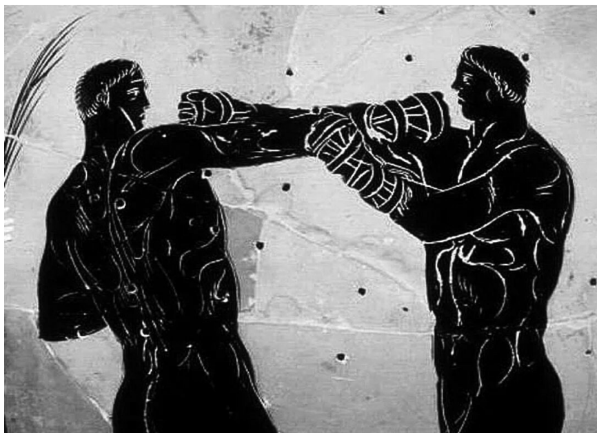
Юмручен бой в древна Гърция

Както се вижда правилата на древния юмручен бой са повече от жестоки и смъртта сред участниците често е естествен завършек на двубоя, нещо, което е било възприемано за напълно нормално.