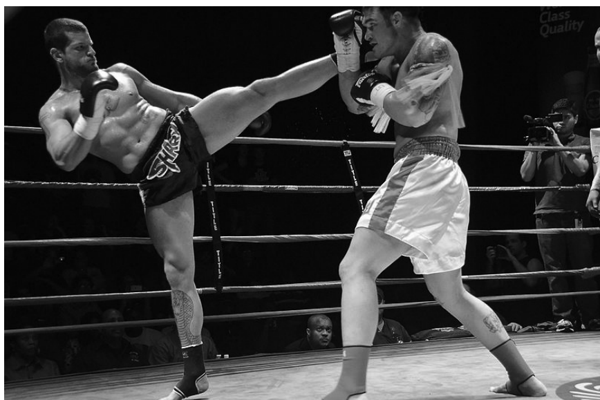
Състезател по муай-тай прави опит за висок удар, но е блокиран от опонента си.

на някои билети достигат до 500 хил. долара. Това са официалните цифри, които се посочват – какви пари са заработени от боя в Лас Вегас в действителност можем само да гадаем.